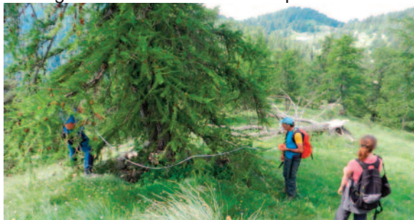
Relevés en prospection archéologique

tion. Le futur Musée est prévu pour accueillir sa propre Réserve. Mais l'espace n'y est pas extensible. Aussi sommes-nous obligés de refuser certains objets - que nous possédons déjà en de nombreux exemplaires - afin de privilégier celui qui sera original dans nos collections. A défaut de bénéficier de plus de place, nous espérons que les généreux donateurs le comprendront.