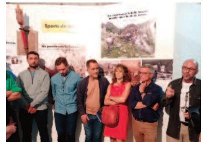
Les sportifs de haut niveau du Haut Pays présents à l'inauguration de l'exposition