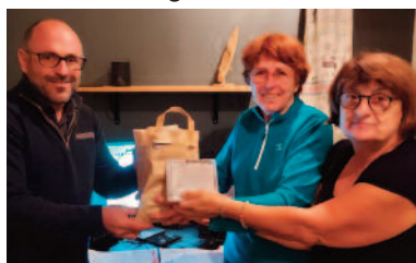
Les 30 premiers CD de données introduits dans l'ordianteur central de l'AMONT

En partenariat avec la municipalité de Moulinet, Pascal a animé la soirée Mémoire (21 septembre) lors de la commémoration des 80 ans de la déportation des habitants du village. Le lendemain, il guidait une visite sur le site de l'Authion