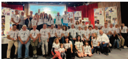
Conférence dans la salle Jean Grinda

Le lendemain (16 juin), l' exposition annuelle (Histoire du Sport dans le Haut Pays) était inaugurée dans la salle du Régina.