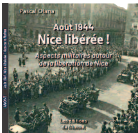
Présentation le 11 décembre au CUM de Nice